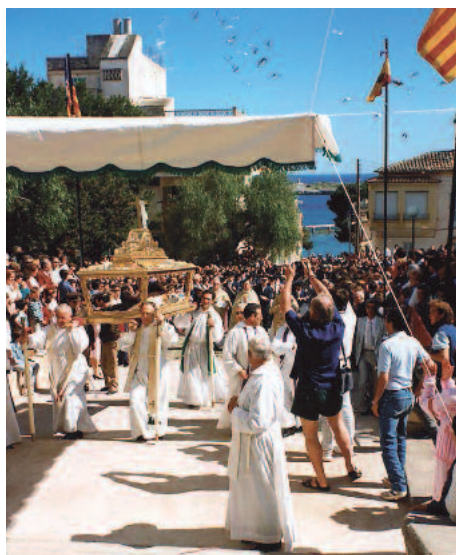
Visita del Sant Crist de 1988

Hagueren de transcórrer més de sis-cents setanta anys perquè la imatge tornàs al lloc on havia arribat en aquella llunyana data. El 27 d'abril de 1939 s'organitzà una peregrinació fins a Porto Cristo en acció de gràcies per l'acabament de la Guerra Civil Espanyola. Més de 25.000 persones s'hi adheriren acompanyant la processó presidida pel clergat amb creu alçada, penons i estendards. La sagrada imatge descansava dins una urna construïda per a l'ocasió. Després de celebrar una solemne missa amb adoració, retornà a Manacor