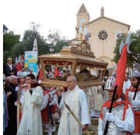
Visita del Sant Crist de 2013