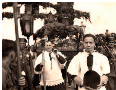
Visita del Sant Crist de 1939

Es prou coneguda entre els manacorins la tradició que recull la miraculosa arribada del Sant Crist a les costes del nostre terme a bord d'una nau d'origen desconegut. A causa d'una forta tempesta, el patró del vaixell prometé deixar al primer port on es poguessin refugiar les tres obres d'art que portava a una església important: les imatges d'un Sant Crist i d'una Mare de Déu de la Neu a més d'una gran campana. Quan el vaixell entrà a Cala Manacor, la mar quedà en calma. Aquest esdeveniment, ocorregut l'any 1260, marca el primer contacte del Sant Crist de Manacor amb l'actual Porto Cristo, aleshores una cala deshabitada.