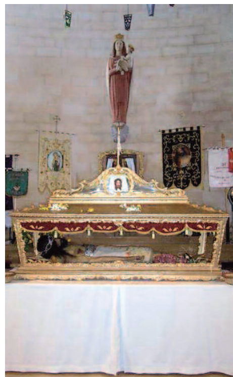
Visita del Sant Crist de 2013

El passat 7 d'abril, milers de persones volgueren acompanyar el Sant