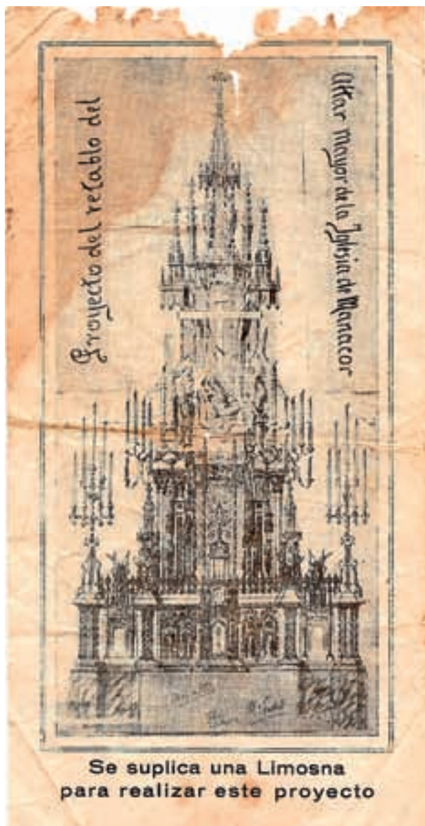
Dibuix del projecte del retaule