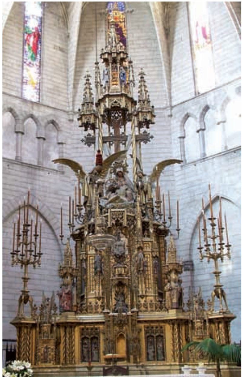
El retaule a l'actualitat

Ara fa just setanta-cinc anys, el nostre retaule fou beneït solemnement per l'Arquebisbe-bisbe Josep Miralles i Sbert.