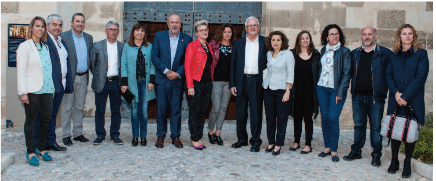
Membres del Patronat de la Fundació i autoritats el dia de la celebració dels 25 anys.

oberts a altra gent, als quals els donam eines per a la millora dels aspectes psicològics, emocionals, conductuals, alhora que milloren les seves destreses, per exemple, en l'àmbit de retorn o accés al món laboral.