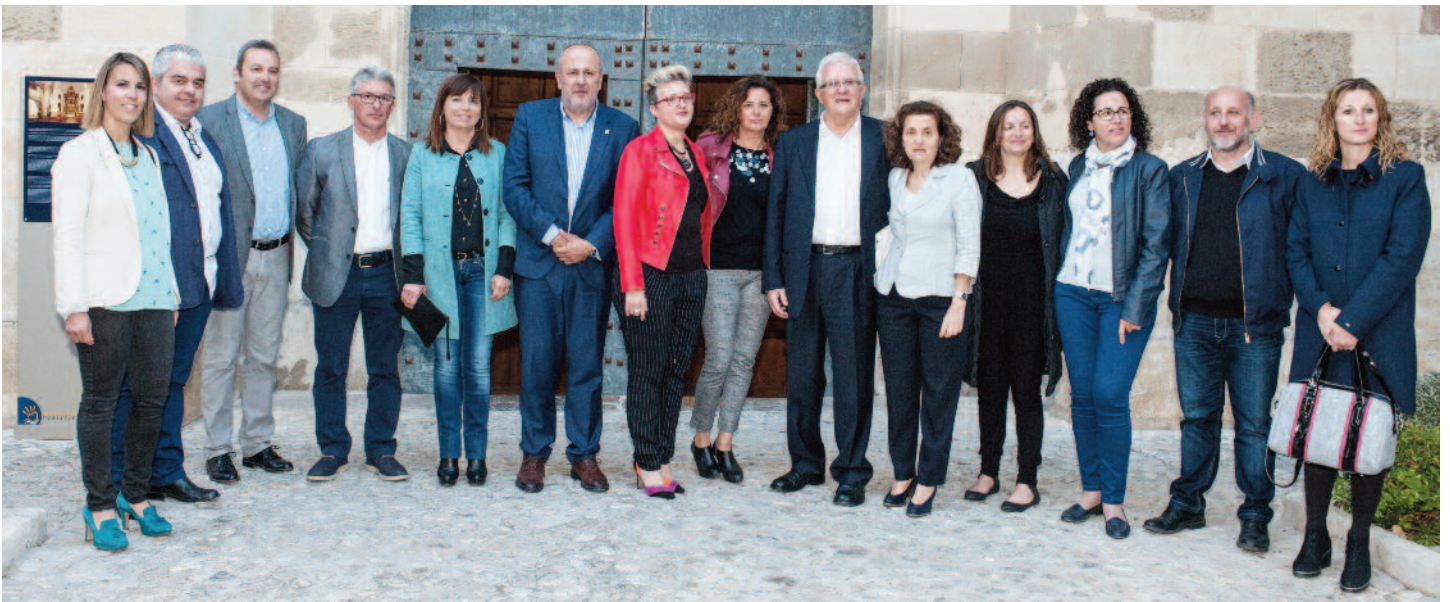
Membres del Patronat de la Fundació i autoritats el dia de la celebració dels 25 anys

oberts a altra gent, als quals els donam eines per a la millora dels aspectes psicològics, emocionals, conductuals, alhora que milloren les seves destreses, per exemple, en l'àmbit de retorn o accés al món laboral.