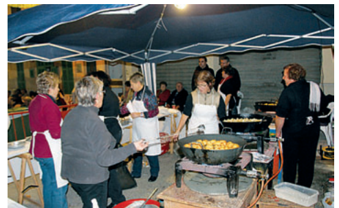
Les bunyoleres al lloc actual.

D'aquests anys, ¿quines anècdotes curioses o 'fets succeïts' podeu recordar?