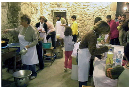
Les bunyoleres en el molí d'en Fraret.

Ja fa, per tant, 38 anys. I hem seguit fins al dia d'avui, amb molta il·lusió.