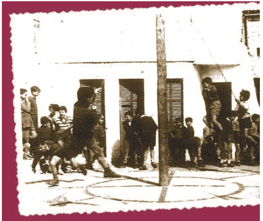
Nins jugant a les anelles al pati de Crist Rei