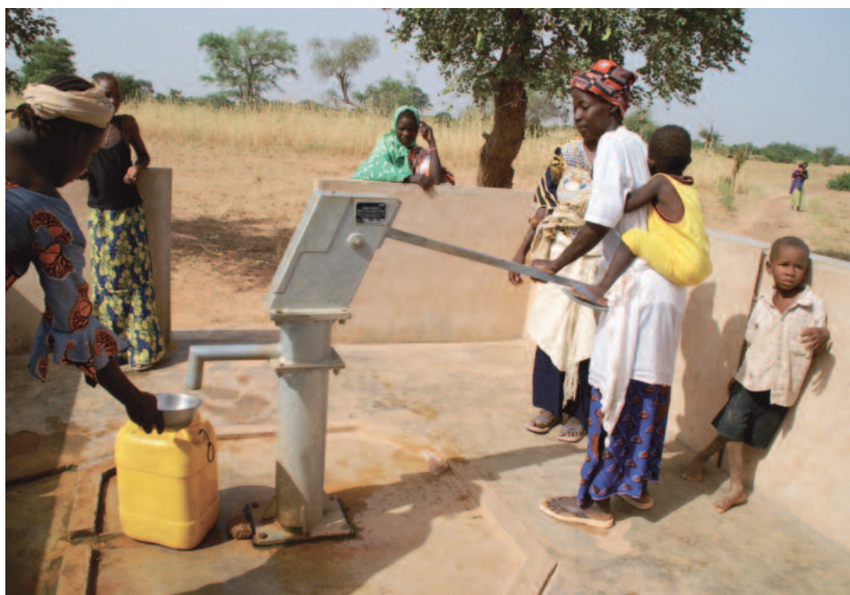
Projecte duit a terme amb l'ajuda de Mans Unides.

Per altra part sabem que ens porta un bé immediat: compartir és una vacuna contra l'egoisme, el pessimisme... equilibra la pròpia vida. No és tant el que dones com el que reps.