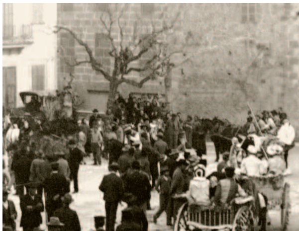
La creu a la plaça del Palau, lloc original.

L'any 1493 es documenta en diferents ocasions la creu 'de detras lo cloquer', és a dir, del campanar. El 13 de novembre de 1633 el visitador general Sebastián de Lenarro la féu col·locar davant de l'hospital que els Jurats de la Vila havien muntat aprofitant les antigues cases de la Rectoria Vella, a l'edifici que actualment ocupa la seu del Patronat de Sant Antoni: 'Se ponga una cruz