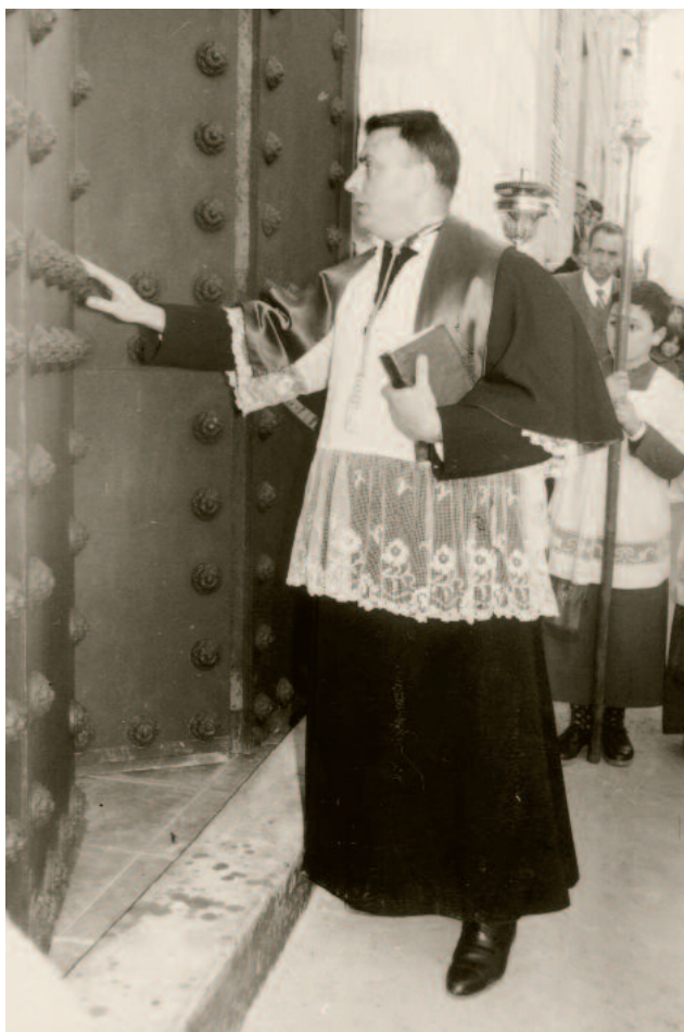
Entrada a Sant Josep. 6-8-1961

El 1980, vaig tornar reenganxar, uns onze anys més. Va ser en aquesta etapa que s'organitzà la Coral, els grups de neteja de l'església, la festa de la Barriada, etc.