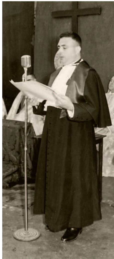
Primera pedra de Sant Pau. 14-9-1963

Encara que, de tot d'una, topàrem amb moltes dificultats, la gent de la barriada de "Sa Torre" cada vegada més prenia consciència parroquial i participava amb més il·lusió. Jo aprofitava les hores de migdia per visitar les cases, i així conèixer les famílies i anar recollint els doblers que necessitàvem per al temple nou. També vaig organitzar una campanya en la que tothom podia participar; li dèiem "campanya del sillar", amb la idea d'aconseguir un cantó de marès per habitant.