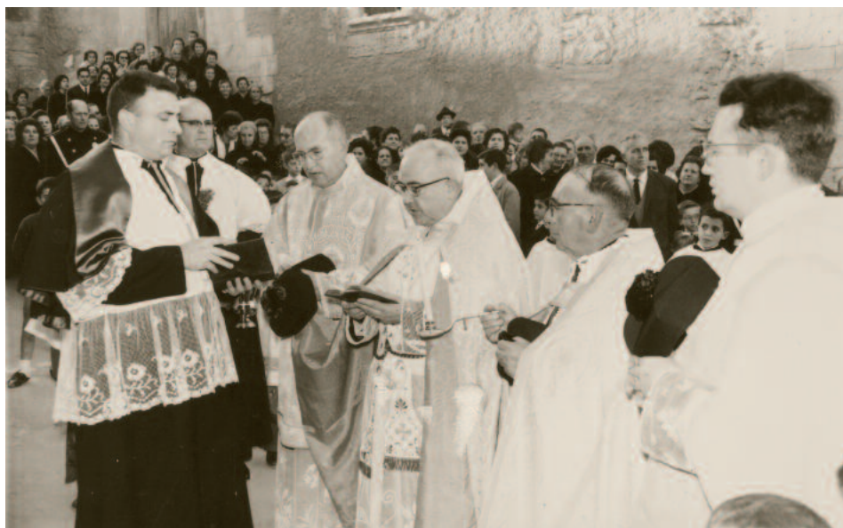
Benedicció de Sant Pau. 24-1-1965

Pel mes de juny de 1955, vaig ser destinat a Son Ferriol, que aleshores devia tenir prop de 900 habitants, en un ambient molt rural. Vul fer notar que, al cap de 5 anys, s'havia duplicat la població.