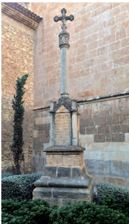
Al Convent de Sant Vicenç Ferrer, lloc actual.

En una data que no hem pogut esclarir la creu es muntà a la plaça del Convent, davant l'església de Sant Vicenç Ferrer, on la podem contemplar actualment... Esperem que per molts d'anys.