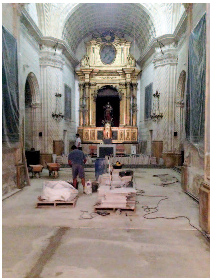
Aspecte de les obres a principi d'aquesta setmana

prou grosses que havien servit com a sepultures. Aquestes foren exhumades entre l'any 1950 i el 1951 amb motiu de la darrera reforma. S'han descobert fins quatre criptes de dimensions diferents.