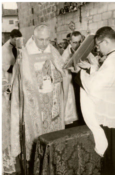
Primera pedra de Sant Pau. 14-9-1963

L'any 1957, poguérem beneir la primera part de l'església, i per aquelles mateixes dates, férem l'escola parroquial, de la qual sortí l'escolania, formada per uns 12 nins.