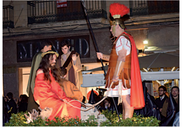
Una altra imatge del pas vivent

Cada any podem comprovar com la gent que 'puja' al pas s'impliquen, s'identifiquen amb el personatge. És una vivència 'mística', indescriptible.