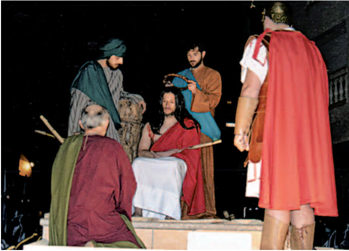
Pas vivent de l'any 2010