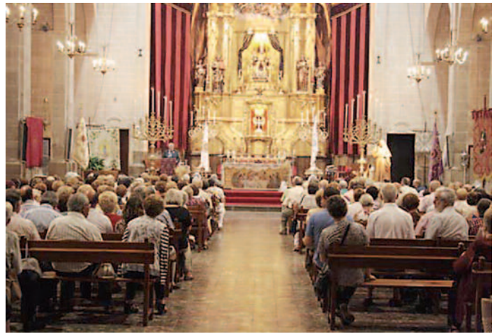
Imatge d'una vigília a l'actualitat.

• Les pregàries de tots, amb participació personal , fent present tantes necessitats de l'Església i de tots els