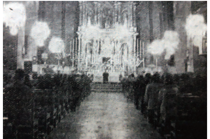
Imatge d'una vigília als anys 1940.